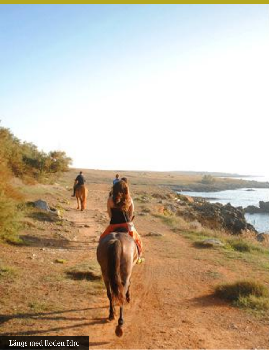
Längs med floden Idro

Vi återvänder sedan till Otranto där var och en är fri att tillbringa resten av dagen bland Otrantos affärer, eller simma vid en liten strand i närheten eller hästriding längs klipporna och beundra solnedgången (lämpar sig även för nybörjare).