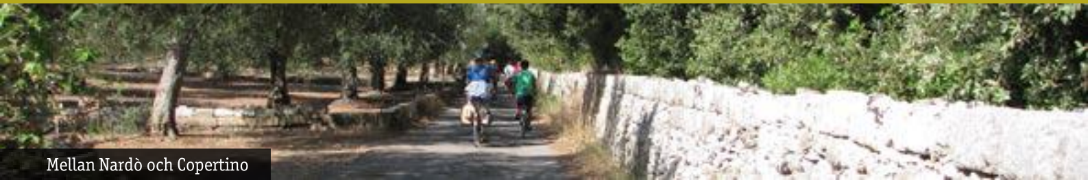
Mellan Nardò och Copertino