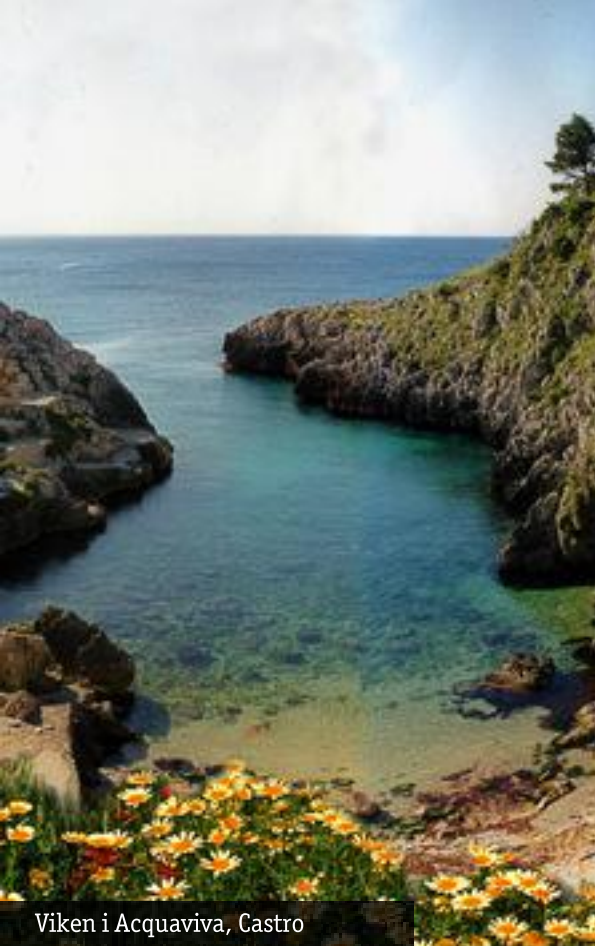
Viken i Acquaviva, Castro

På kvällen stannar vi i Leuca, där vi besöker helgedomen, i de forna pilgrimernas fotspår.