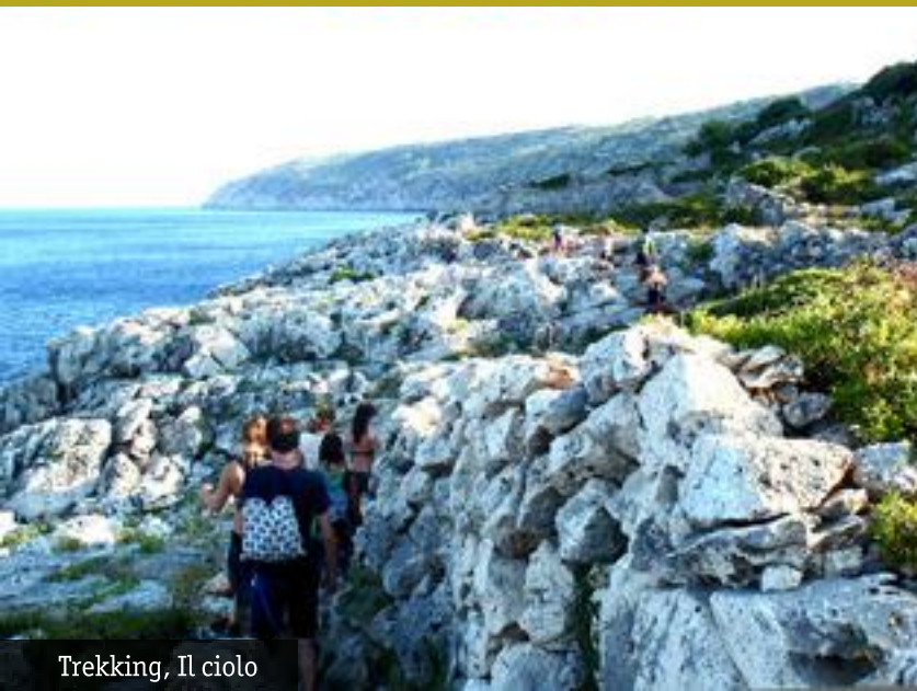
Trekking, Il ciolo