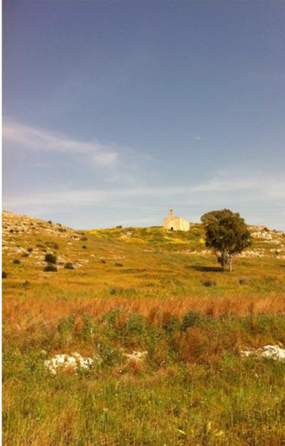
Kyrkan i San Mauro

På eftermiddagen finns det möjlighet att kajakpaddla i nationalparken.