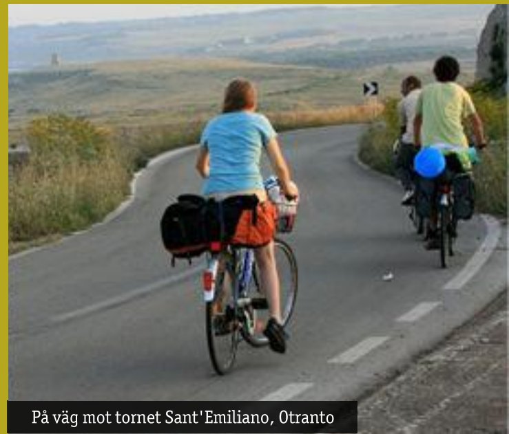
På väg mot tornet Sant'Emiliano, Otranto