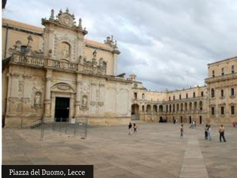
Piazza del Duomo, Lecce

Efter en guidad tur runt en av de vackraste städerna i Italien är det dags att säga adjö till Salento!