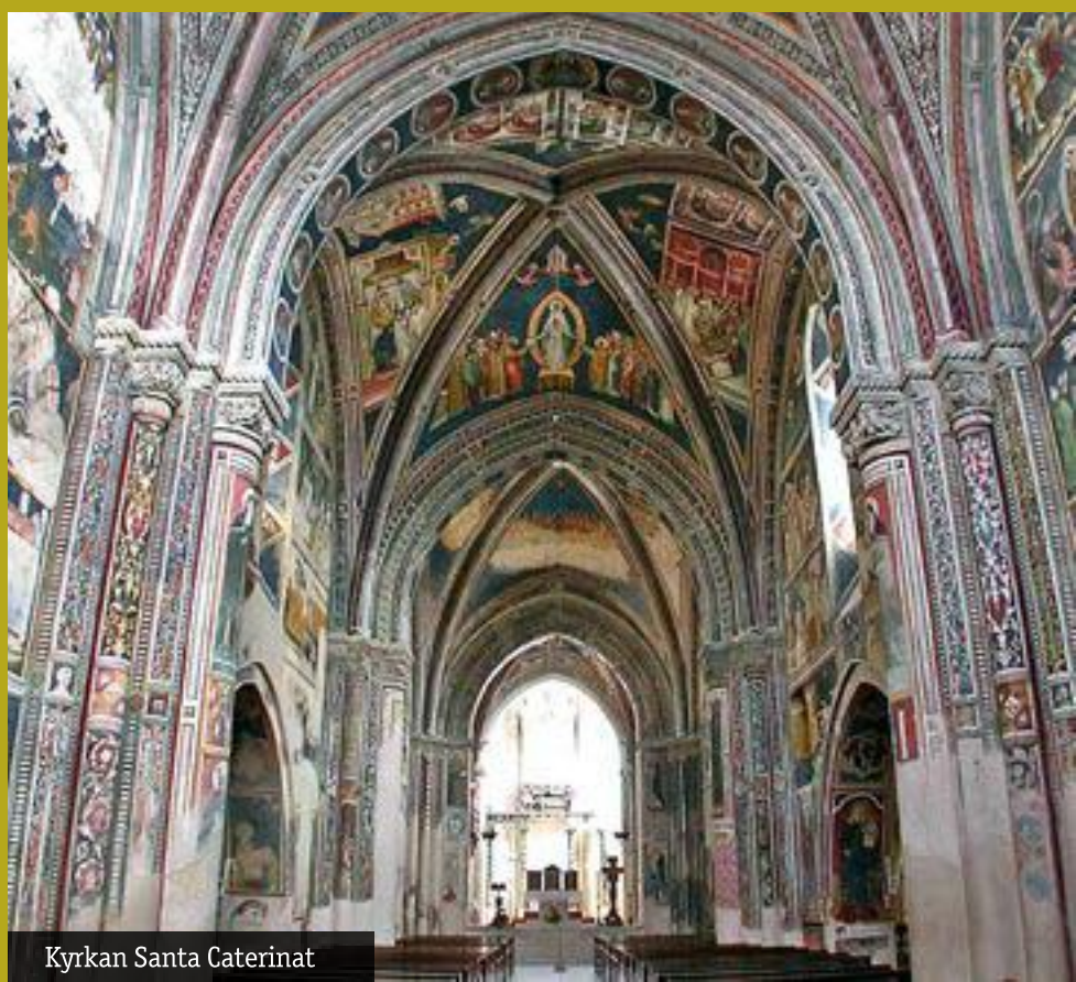
Kyrkan Santa Caterinat

Det höga tornet, framför vårt Bed&Breakfast