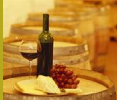
Negroamaro-vin och färsk ost