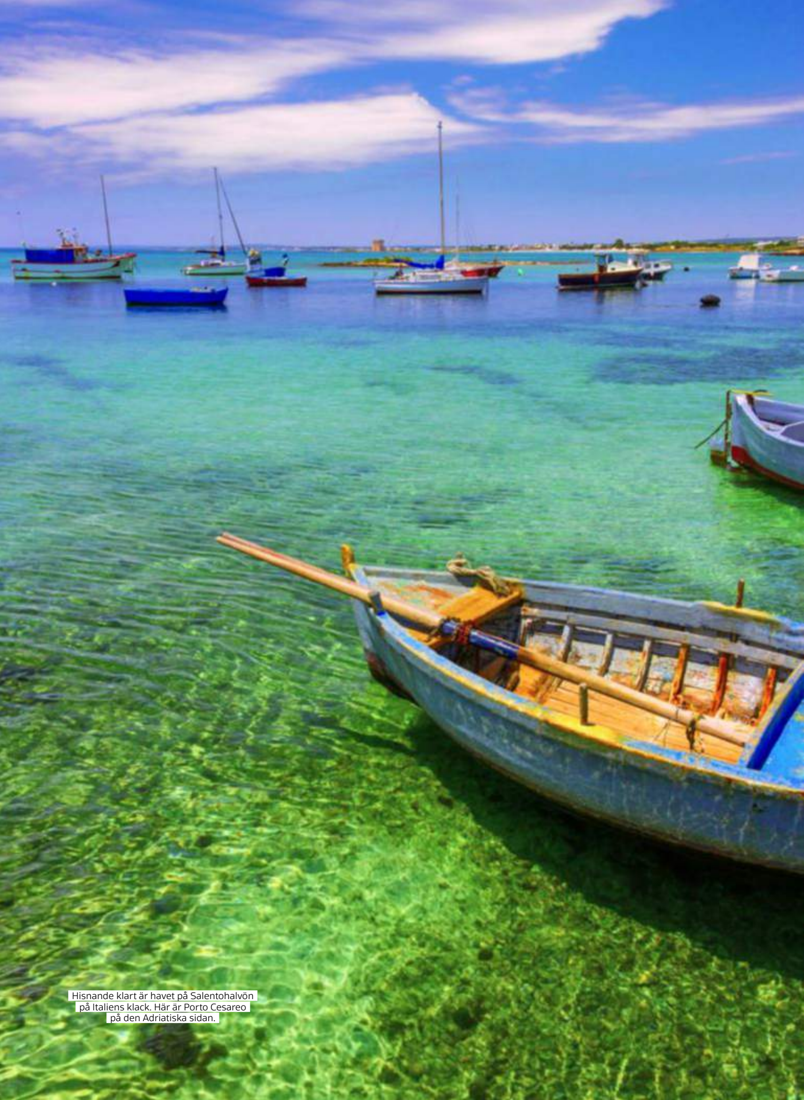
Hisnande klart är havet på Salentohalvön på Italiens klack. Här är Porto Cesareo på den Adriatiska sidan.