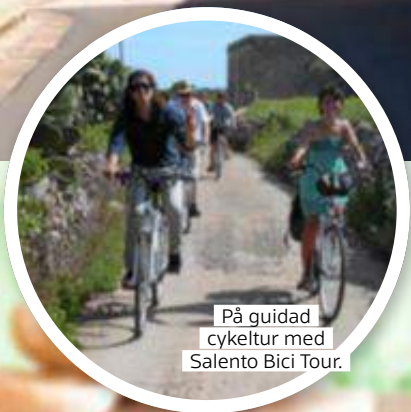
På guidad cykeltur med Salento Bici Tour.

I Italien är det ingen motsättning mellan vandring och livsnjutning. Var man än kommer spelar maten och drycken en central roll. Apulien är Italiens största olivoljeproducent. Överallt träffar vi på entusiaster som värnar om mattraditionerna.