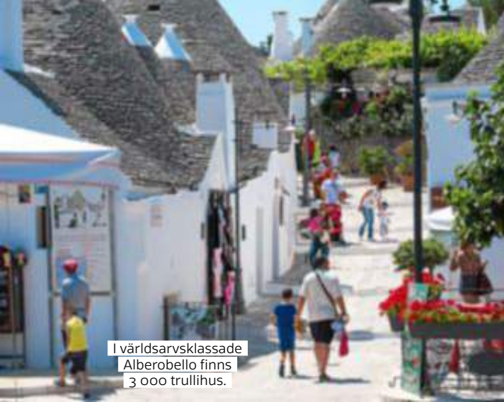
I världsarvsklassade Alberobello finns 3 000 trullihus.