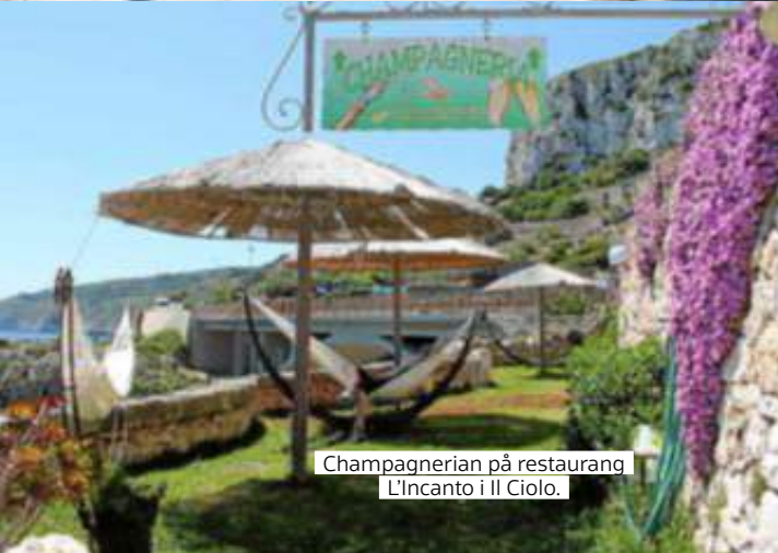
Champagnerian på restaurang L'Incanto i Il Ciolo.