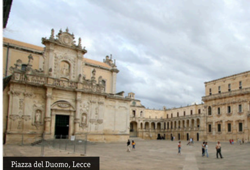
Piazza del Duomo, Lecce