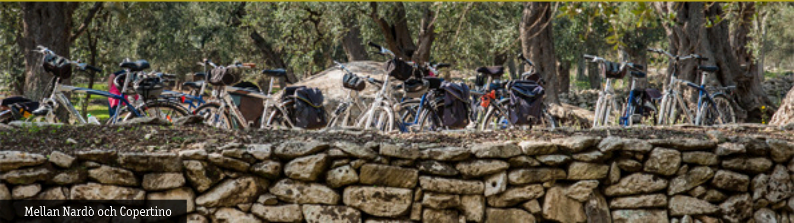
Mellan Nardò och Copertino