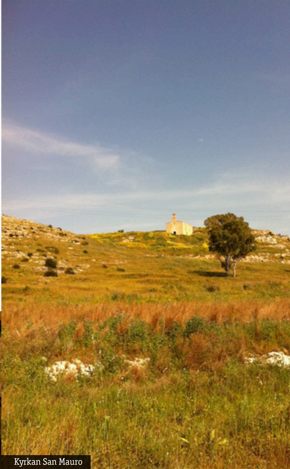
Kyrkan San Mauro