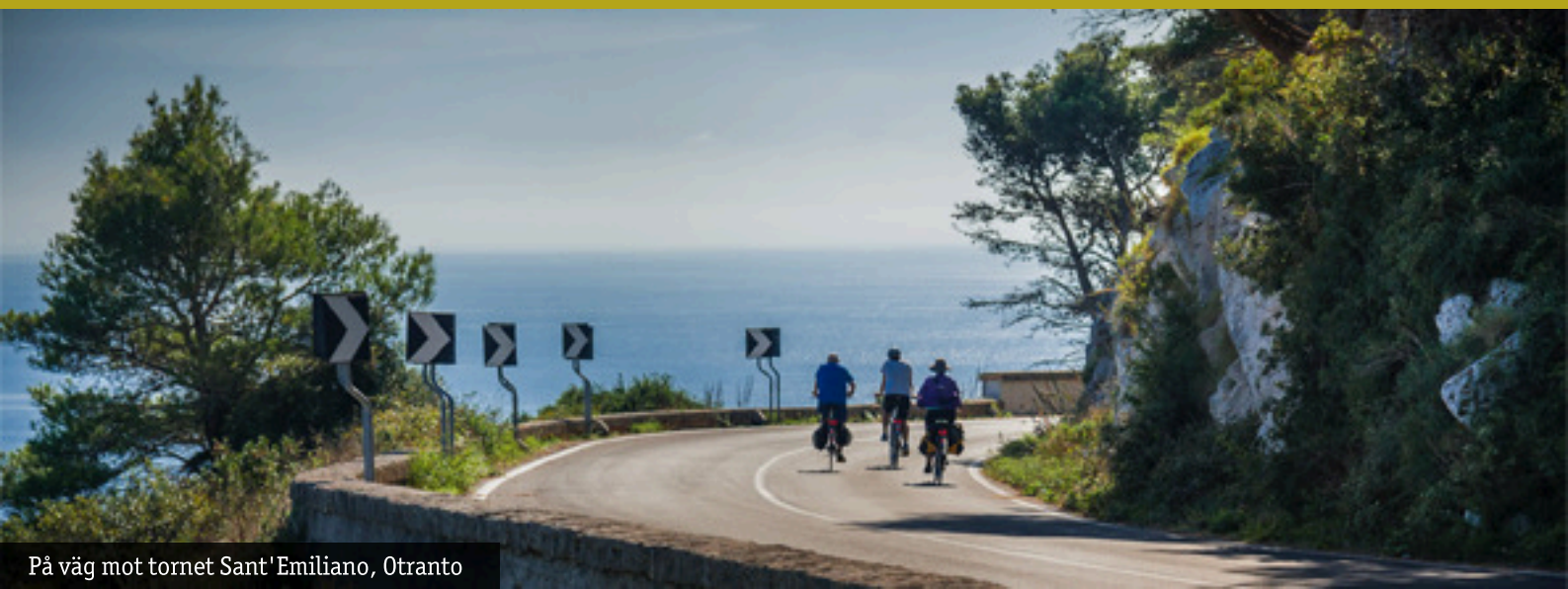
På väg mot tornet Sant'Emiliano, Otranto

På kvällen stannar vi i Leuca, där vi besöker helgedomen, i de forna pilgrimernas fotspår.