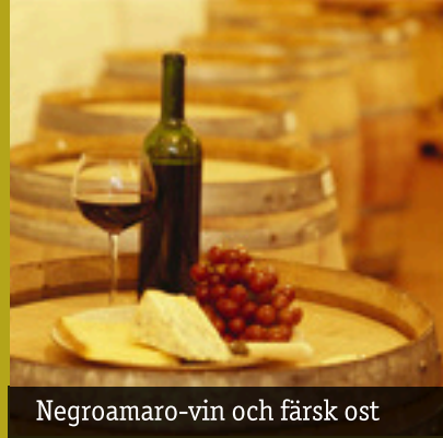
Negroamaro-vin och färsk ost