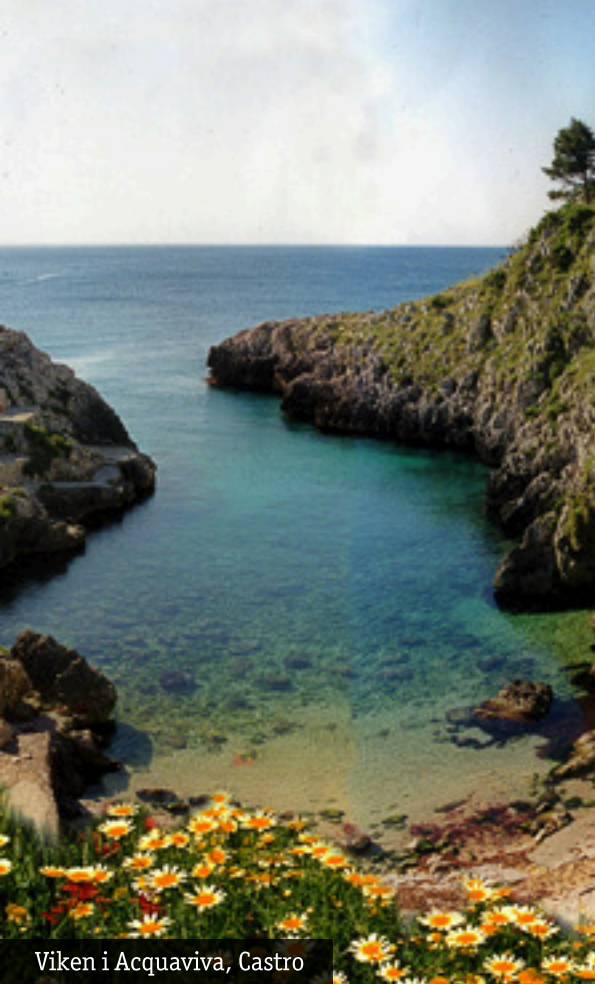
Viken i Acquaviva, Castro