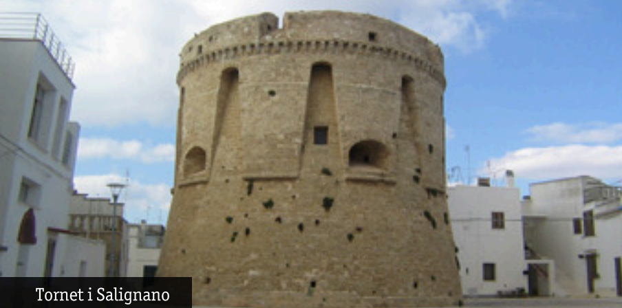
Tornet i Salignano